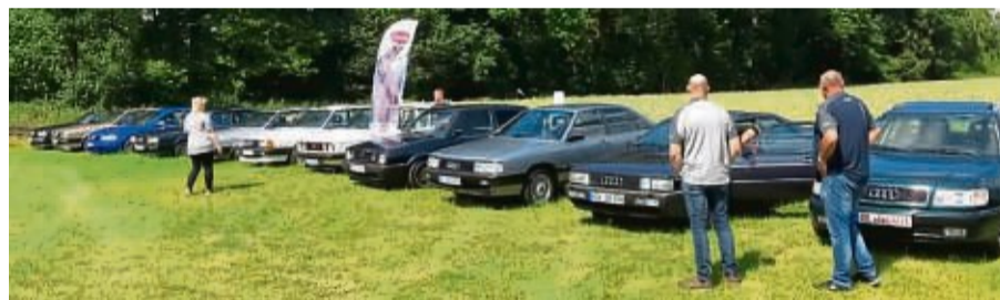
Eine abwechslungsreiche „Alt Audi Midsommer Ausfahrt“ begeisterte die Teilnehmer.